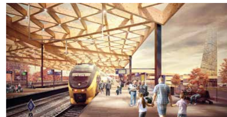
De kenmerkende, houten stationskap en het nieuwe perron 5.

De P+R garage heeft ruim 500 parkeerplaatsen en ligt aan de zuidzijde van het nieuwe station. Het is een garage met vier verdiepingen, waarvan drie bovengronds. Vanuit de parkeergarage is de hoofdentree snel en gemakkelijk te bereiken.