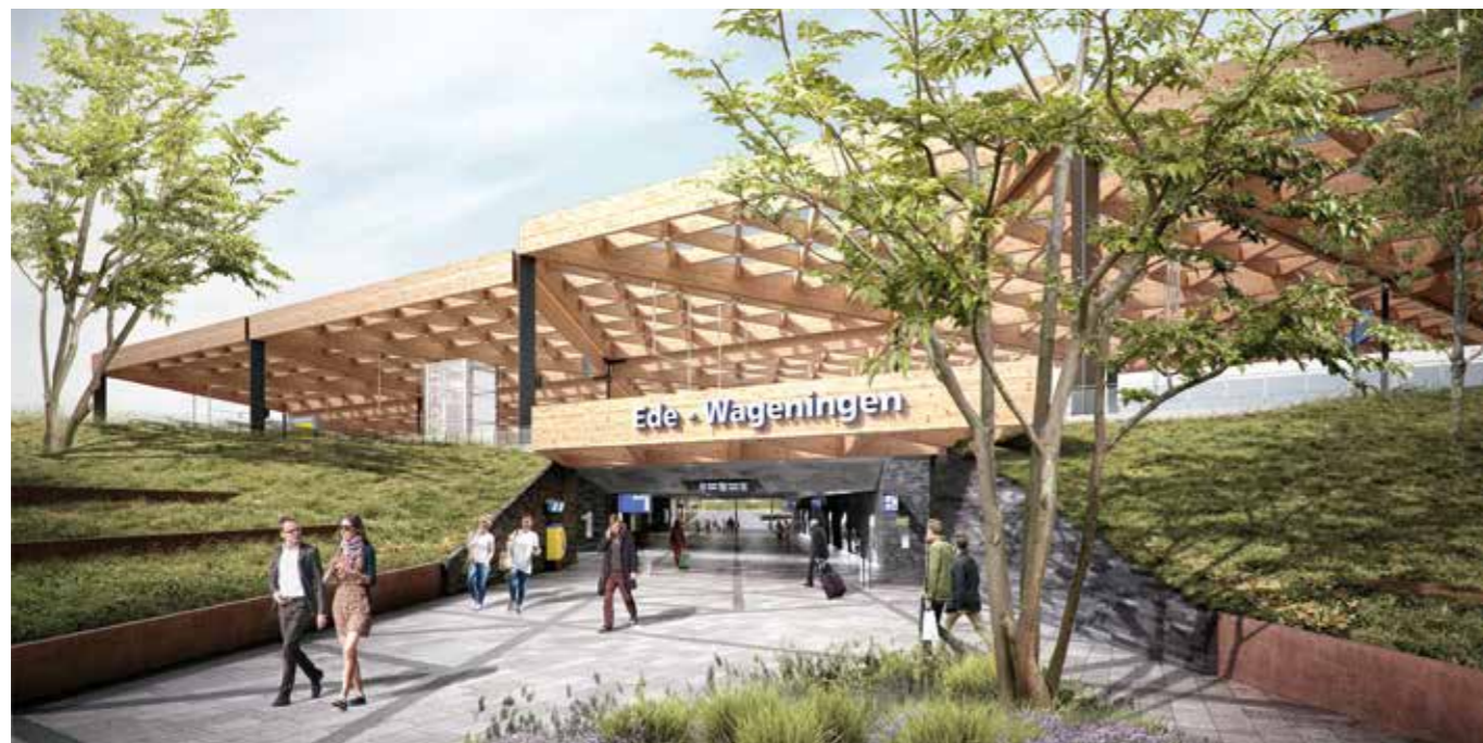
Vanuit de ruime (oostelijke) reizigerstunnel komt de reiziger aan de noordzijde uit in het groene en nieuwe Frisopark.

Aan de westzijde van het station en tussen het viaduct Sysselt en het station wordt geluidswering aangebracht. Aan de zijde van de Parkweg komt een geluidsscherm tussen de westelijke tunnel en het begin van de Blokkenweg.