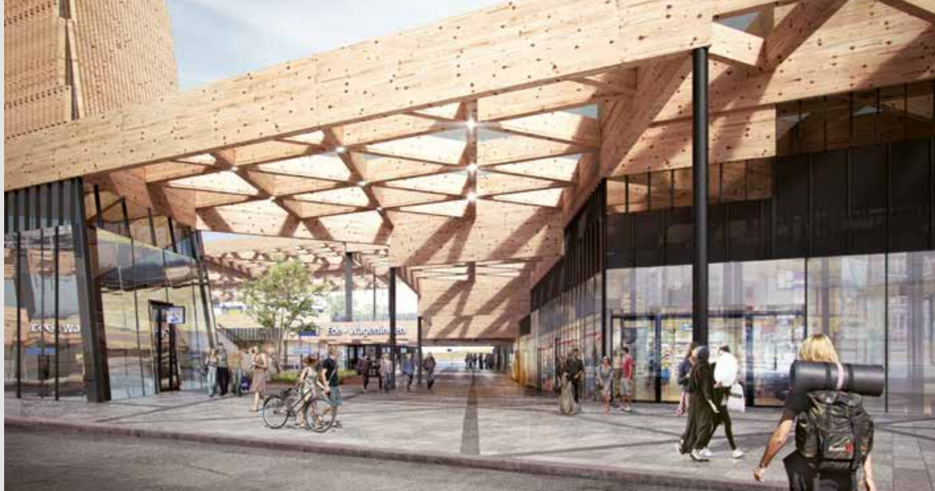
De hoofdentree met (links zichtbaar) de voet van de markante toren. Hier vindt de reiziger stationswinkels, wachruimte, informatie en toiletten.